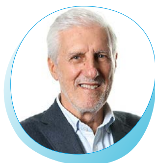
António Sarmento Presidente da WAVEC - Offshore Renewables